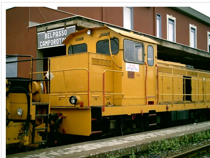
Foto di una locomotiva diesel ex RD.142 FS nella stazione FCE di Belpasso-Camporotondo

Le due locomotive sono state costruite dalla FIPEM di Reggello (Firenze) secondo uno schema affermato; cabina di guida centrale con doppi comandi e avancorpi asimmetrici nei quali trovano posto le apparecchiature meccaniche. Si è fatto ampio ricorso a componenti comuni ad altri gruppi del parco FS; L'uso di componenti comuni venne previsto perché, essendo il gruppo di numero esiguo, ci sarebbero stati seri problemi di reperimento dei ricambi in caso di avarie. Il motore, un Breda-Isotta Fraschini diesel a 8 cilindri e quattro tempi ad alimentazione naturale con cilindrata di 30.870 cm 3 . Era lo stesso delle locomotive a scartamento ordinario 235 delle FS. Così pure la trasmissione del tipo idraulico Voith. I carrelli